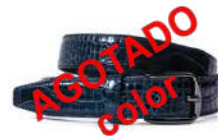
022 Azul marino