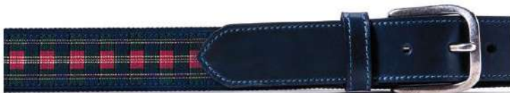
62103 / 289

Ancho: 40 mm. Talla: 85-120, 125-140 Hebilla: Niquel matizado