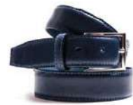
022 azul marino