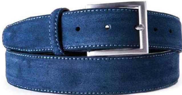
022 Azul marino