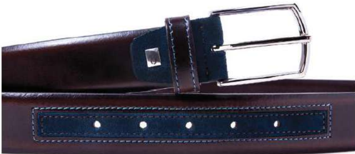
037 Marrón 022 Azul marino

Ancho: 35 mm. Talla: 85-120 Hebilla: Niquel brillo